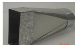
Instort verloop - Ø125mm