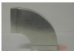
Instort bocht 90°